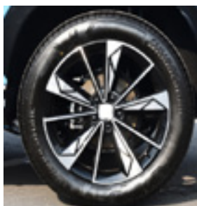
Jante aliaj 19"