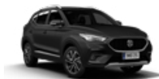
Pebble Black (metallic)