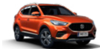
Hoxton Orange (metallic)