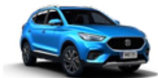
Cosmo Blue (metallic)