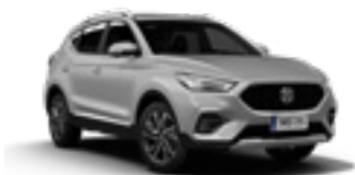
Monument Silver (metallic)