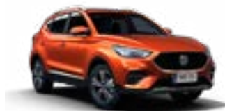
Hexton Orange (metallic)