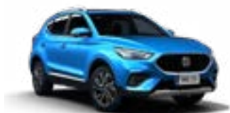
Cosmo Blue (metallic)