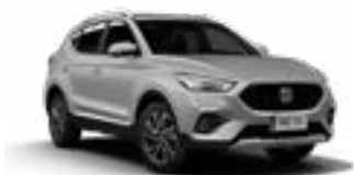
Monument Silver (metallic)