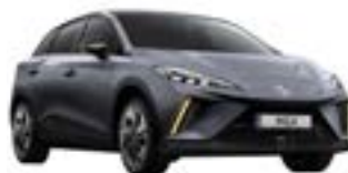
● Andes Grey