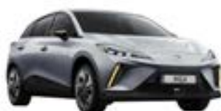
● Medal Silver