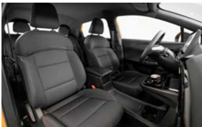
Interior negru: tapițerie din stofă neagră