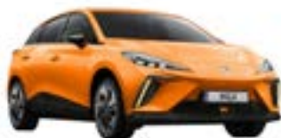
● Fizzy Orange