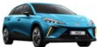
● Brighton Blue