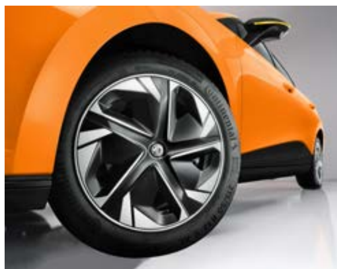
Jante din aliaj de 17" cu capace în două tonuri