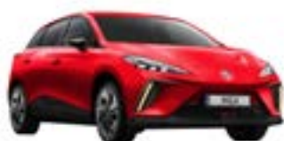
● Diamond Red