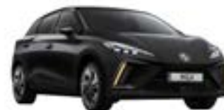
● Pebble Black