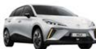
○ Dover White

*Prețul exprimat în Lei reprezintă prețul calculat pe baza cursului valutar de schimb RON/EUR estimativ de 5 RON/EUR. Plata se va face în RON la cursul de vânzare ING BANK din ziua efectuării plății, disponibil la adresa https://ing.ro/curs-valutar-pj - curs valutar standard aplicabil persoanelor juridice / ING Vinde. Plata se va face în RON la cursul de vânzare ING BANK din ziua efectuării plății, disponibil la adresa https://ing.ro/curs-valutar-pj - curs valutar standard aplicabil persoanelor juridice / ING Vinde. Imaginile afișate au caracter ilustrativ.