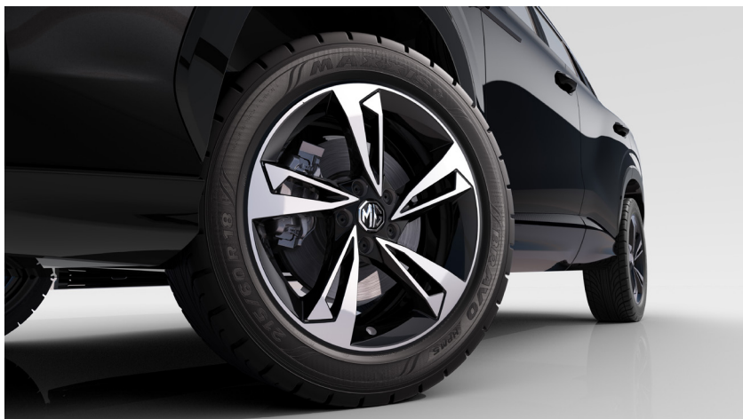
Jante aliaj 19"